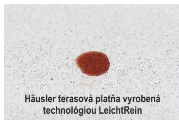
Häusler terasová platňa vyrobená technológiou LeichtRein