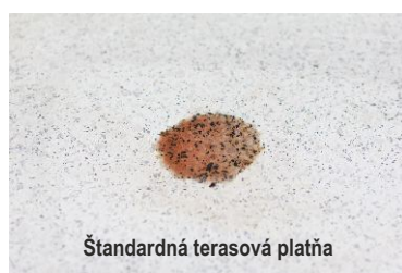
Štandardná terasová platňa

Upozorňujeme na špeciálne vlastnosti montážneho materiálu Häusler. Viac informácií k jednotlivým technikám pokládky a cenník montážneho materiálu nájdete na www.hausler.sk